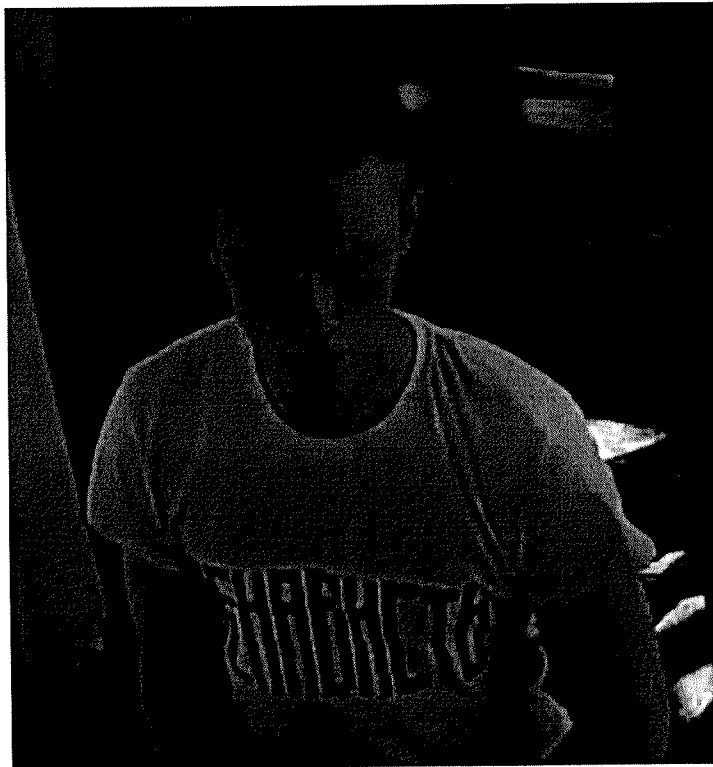
Владислав Росляков 2018 г.