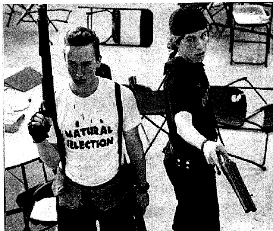
Эрик Харрис и Дилан Клиболд 20.04.1999 г.