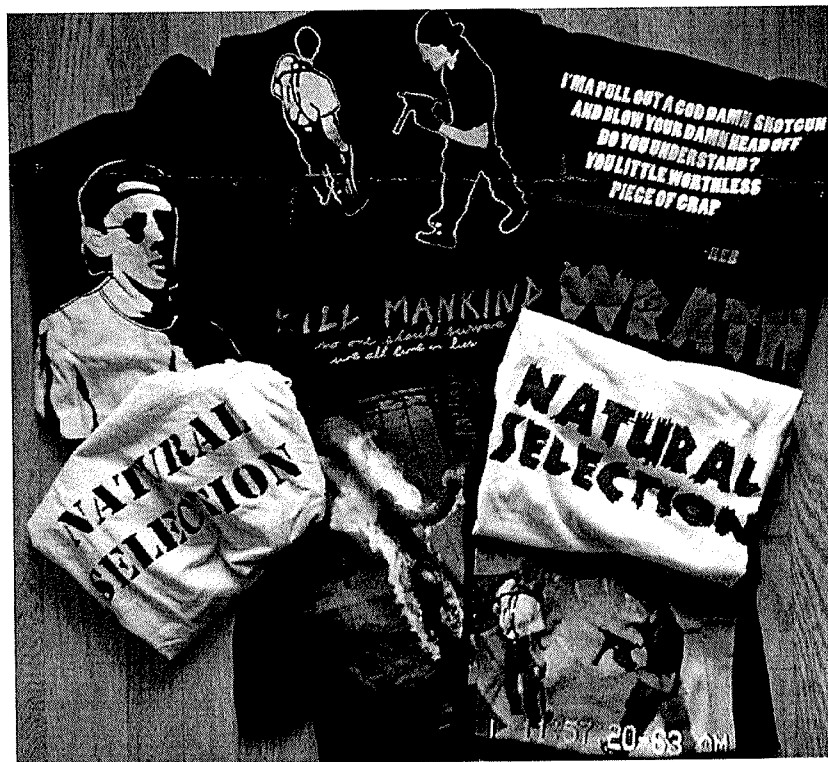
Возможные варианты одежды