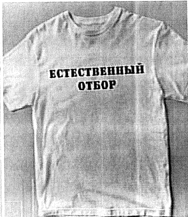
Возможные варианты одежды