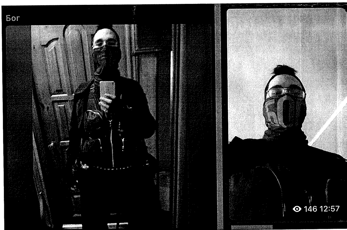
Ильназ Галявиев 2020 г.