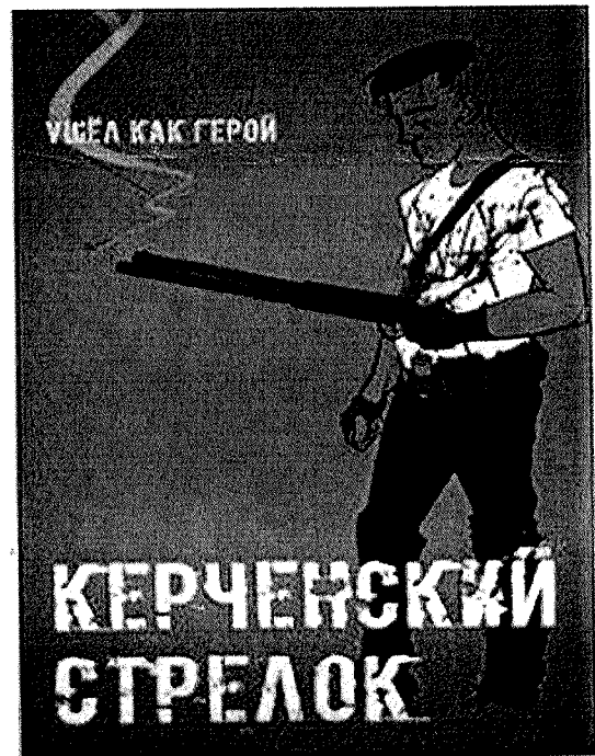
Возможные изображения в социальных сетях, мобильных телефонах, планшетах