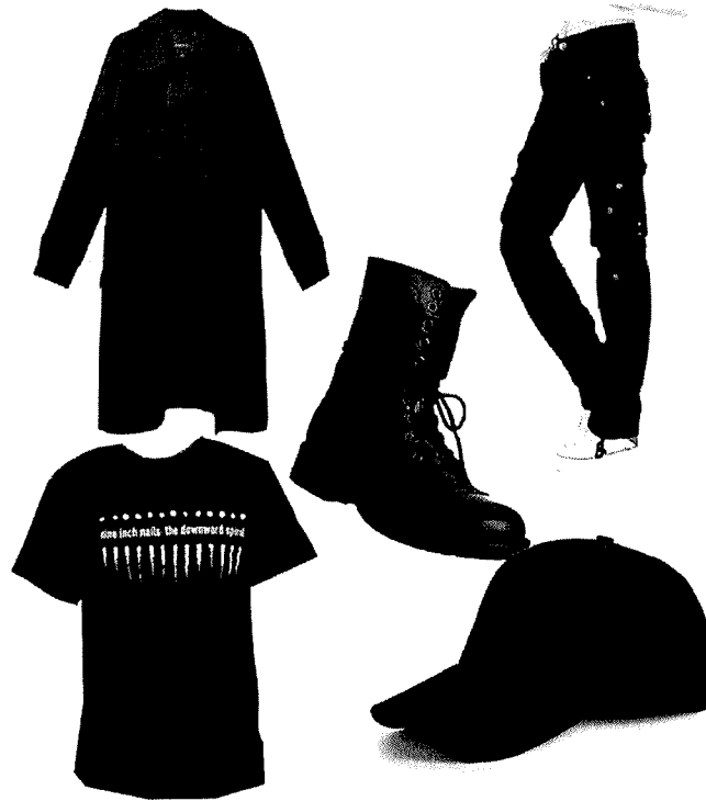
Возможные варианты одежды